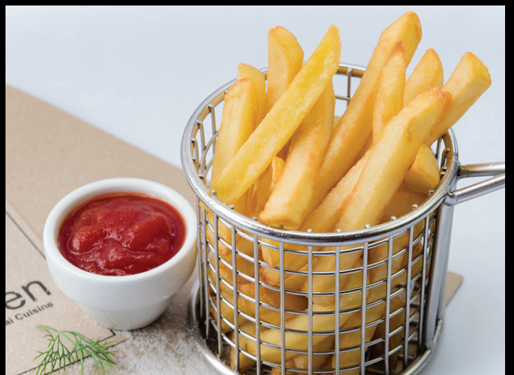
06. FRENCH FRIES 100- เฟรนช์ฟรายส์

All prices are subject to government taxes 7%