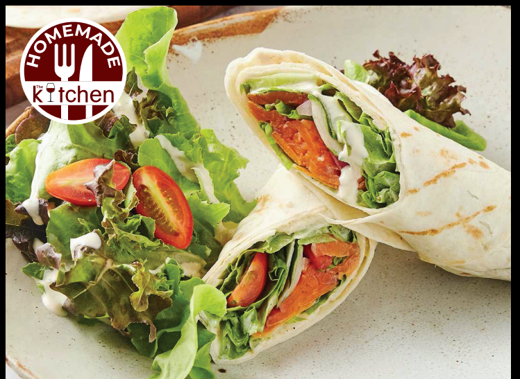
04. SALMON WRAP 240- Smoked salmon, lettuce, tomato, cucumber, light chives sour cream, served with green salad แร็พปลาแซลมอนรมควัน ผักกาดหอม มะเขือเทศ แดงกวาง และ ครีมเปรี้ยวไซมันต์ารสดหอม เลิร์ฟพร้อมกัปลัด