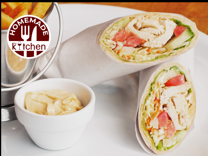
03. CHICKEN WRAP 220- Slices of roasted marinated chicken breast, lettuce, tomato, cucumber, curry mayonnaise sauce, served with green salad แร็พอกไก่ ผักกาดหอม มะเขือเทศ แดงกวาง และ ครีมซอสเครื่องแกง เลิร์ฟพร้อมกัปลัด